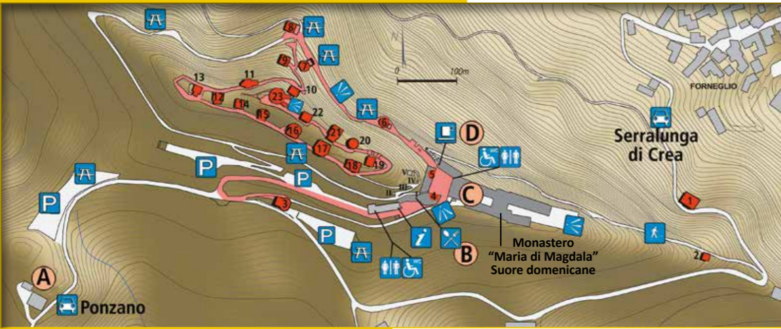
Cartographie de l'Université de Gênes - École Polytechnique - Département D.S.A.