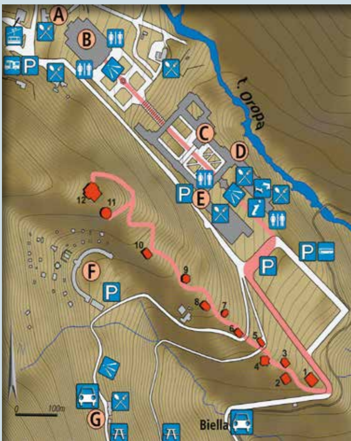
Cartografia a cura dell'Università degli Studi di Genova Scuola Politecnica - Dipartimento D.S.A.

Completata dalla Comunità di Occhieppo Superiore, a pianta ottagonale all'esterno e ellittica all'interno, dove si svolge l'incontro tra Maria e la cugina Elisabetta. Il gruppo scultoreo, realizzato da P.A. Auregio è incentrato sull'abbraccio delle due donne tra gli sguardi discreti di S. Giuseppe (a destra) e S. Zaccaria (a sinistra).