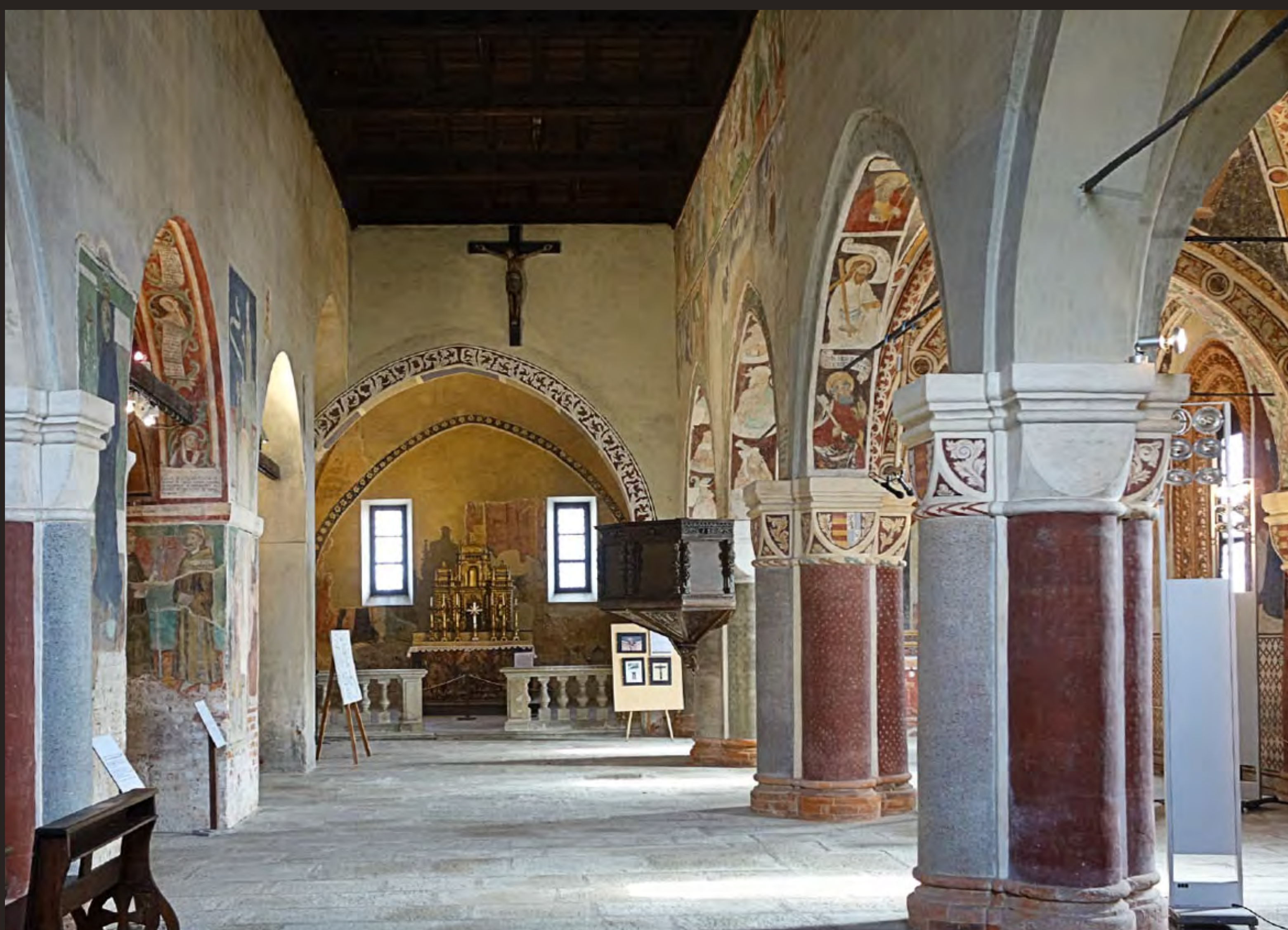
Navata centrale

Storico Architettonico Architectural History