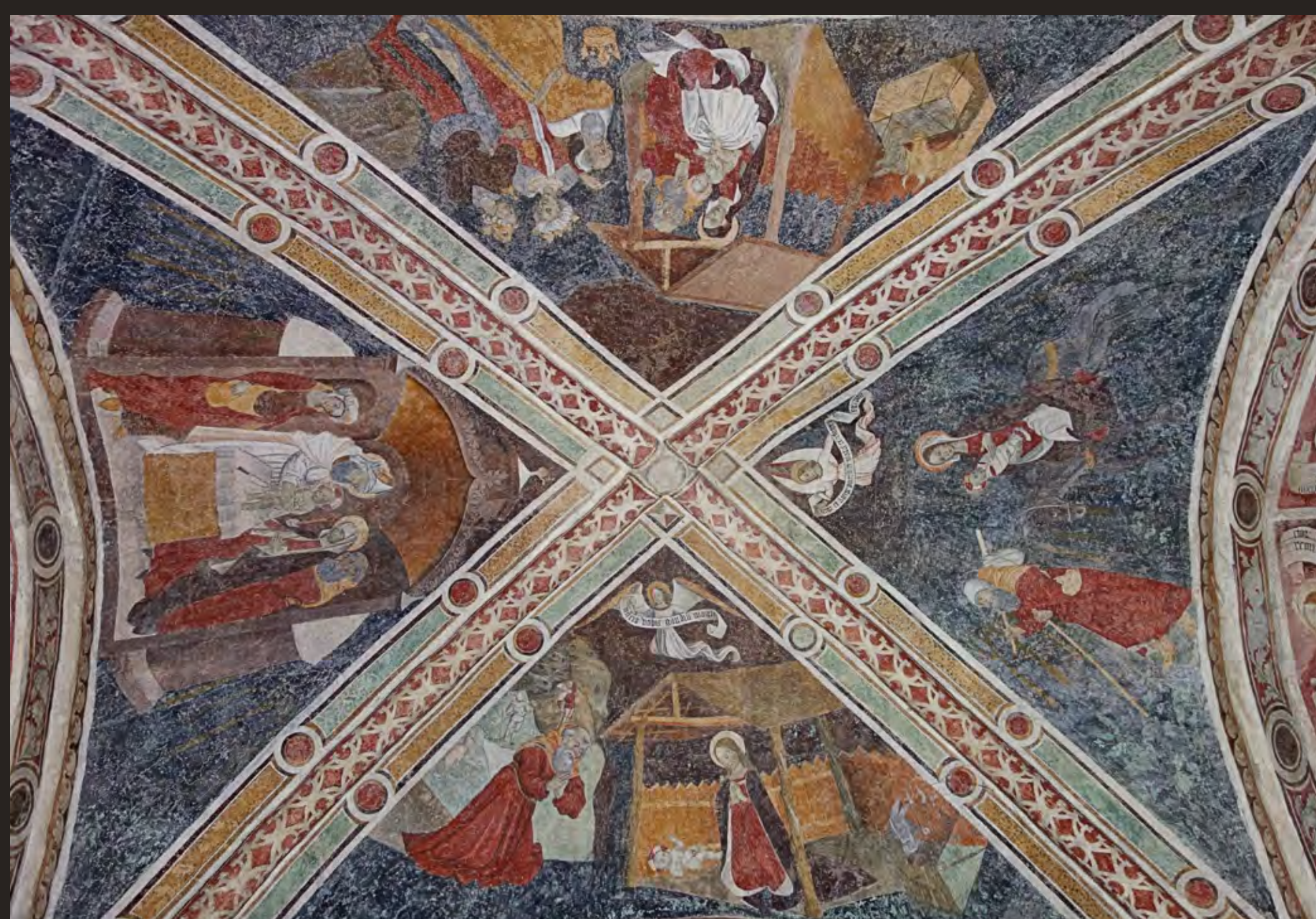
Affresco della volta con scene dell'infanzia di Cristo

Il celebre architetto Alfredo D'Andrade nel 1884 riprodusse gli affreschi della facciata sud, allora ancora visibili, nella chiesa del Borgo Medievale a Torino. Dal sagrato della chiesa, circondato un tempo dai vigneti del Castello, si può vedere il versante Sud-est del Sacro Monte di Belmonte ed il suo Santuario, mentre verso Sud si può osservare oltre il centro storico di Valperga uno scorcio della pianura, in direzione degli abitati di Busano e Rivarolo Canavese fino alla collina torinese.